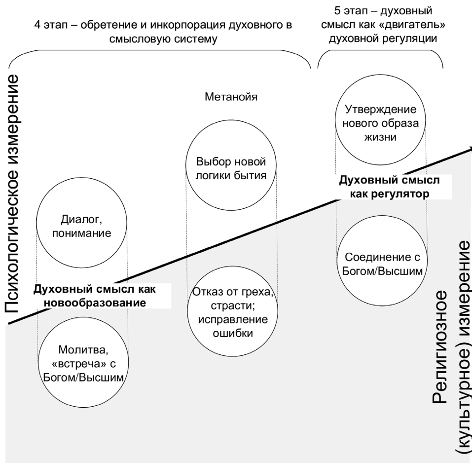
Этапы переживания духовного кризиса (этапы 4, 5)