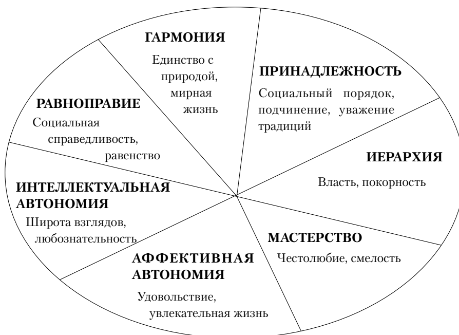
Культурные ценностные ориентации: теоретическая структура