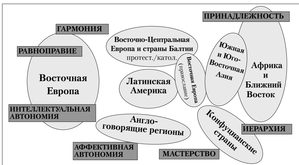
Карта культурных регионов мира

ориентация на иерархию и гармонию , но не на принадлежность , являющуюся смежной с ними; сильно выражена интеллектуальная автономия , но не смежное равноправие . Такие данные по Японии приводят к неправильному ее размещению на карте. Однако это неожиданное сочетание элементов не удивит исследователей японской культуры (Benedict, 1974; Matsumoto, 2002). Оно указывает на культуру, переживающую переходный период и развивавшуюся в условиях внутреннего напряжения.